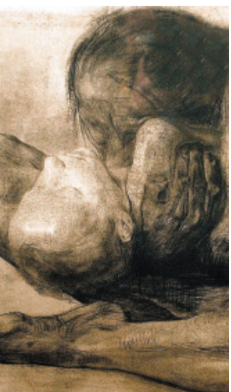
Anrührend: „Mutter und totes Kind“, Ausschnitt aus der Kollwitz-Radierung von 1903.