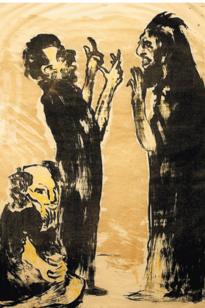
Heftig: Man glaubt förmlich den Wortwechsel zu hören. 1912 arbeitete Emil Nolde die Lithographie „Diskussion“, die Männer in lebhaftem Gespräch und reger Gestik zeigt.