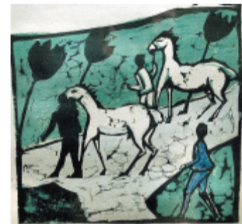
Lebendig: „Weiße Pferde“, Holzschnitt nach dem Mehrplattenprinzip von Erich Heckel.