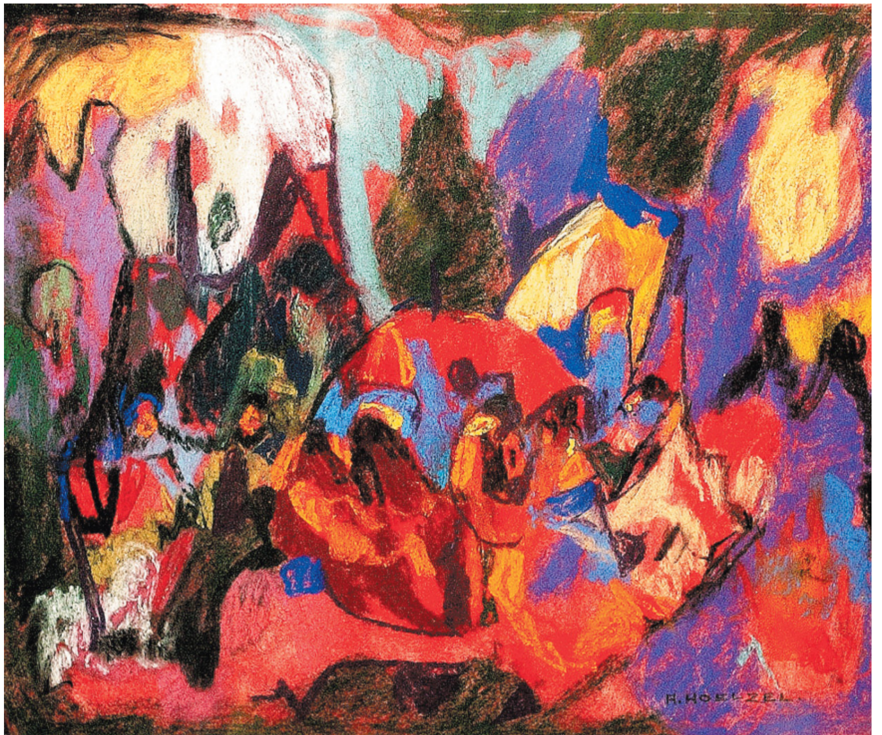
Leuchtend: Fernab vom Kunstbetrieb arbeitete der Süddeutsche Adolf Hölzel an seinen bildnerischen Visionen. Zwei farbstärke Gouachen (Malereien mit Wasser-Deckfarben) aus dem Jahr 1934 sind im Pöppelmann-Haus zu sehen, hier die „Farbkomposition II“.