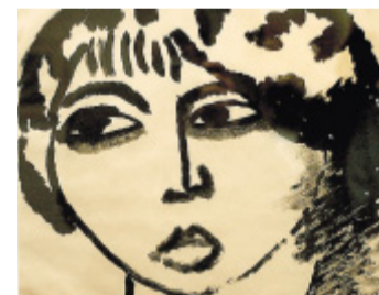
Prägnant: Alexej von Jawlensky schuf 1912 die Lithographie „Mädchenkopf“ (Ausschnitt).