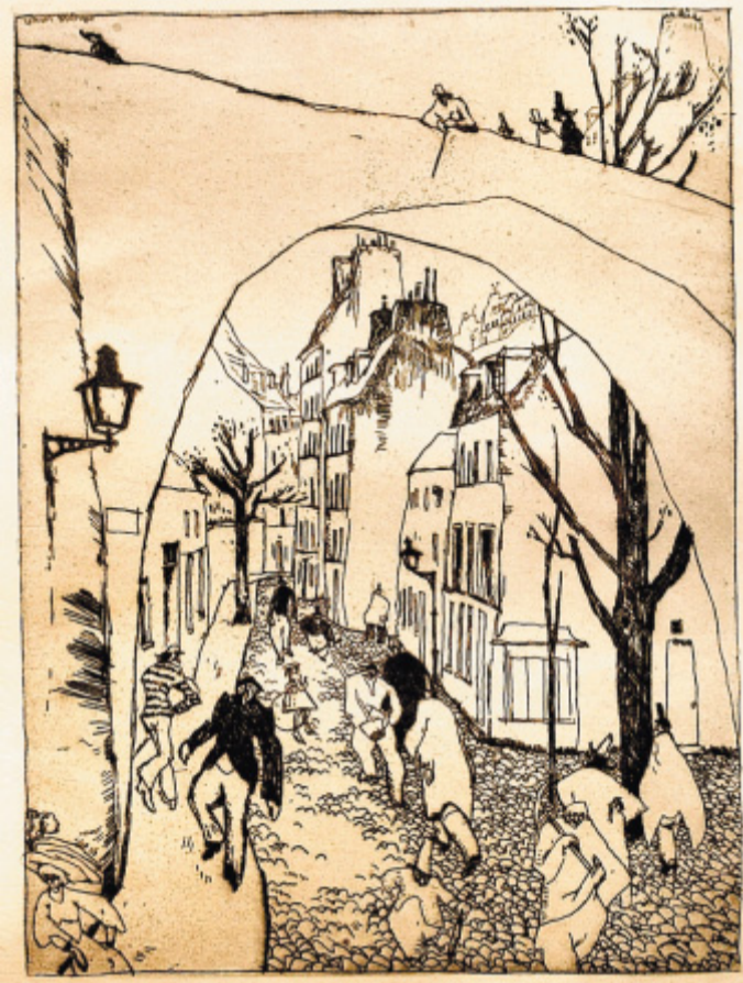
Detailreich: Vor fast 100 Jahren ritzte Lyonel Feininger das Motiv „Grüne Brücke“ in die Zinkplatte. Die Kaltnadelradierung besticht durch ihren Reichtum an Architekturformen und Personen.