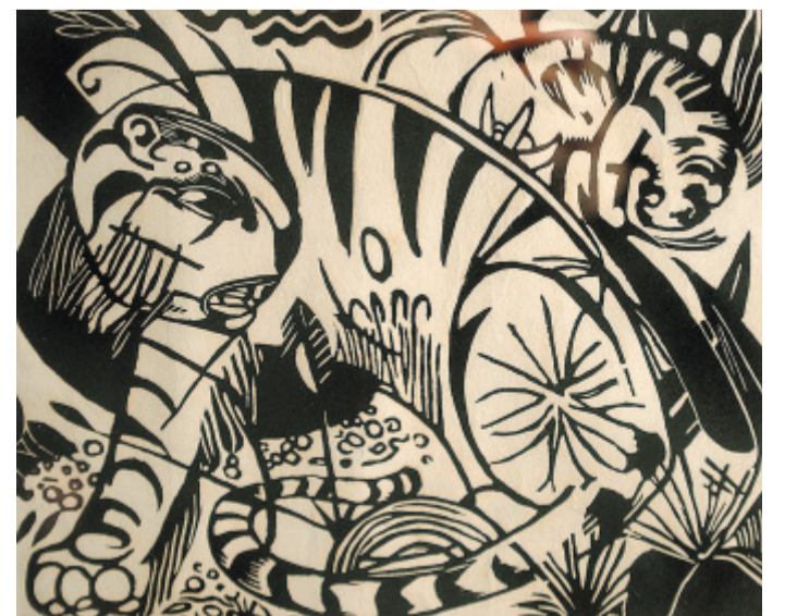
Markant: „Tiger“, von Franz Marc 1912 in Holz geschnitten. Die Körper der stilisiert dargestellten Tiere sind ineinander verschlungen. Das lässt das Motiv fast ornamental erscheinen.