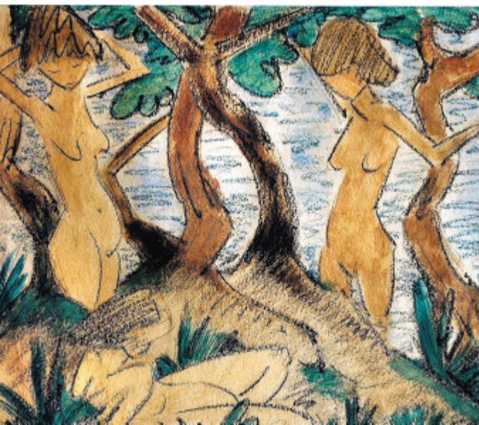
Intim: „Badende zwischen Bäumen“ hat Otto Mueller die 1920 gemalte Mischtechnik aus Kreide und Tempera betitelt. Die sehr vertraut anmutende Szene zeigt drei Nackte am Ufer eines Gewässers.