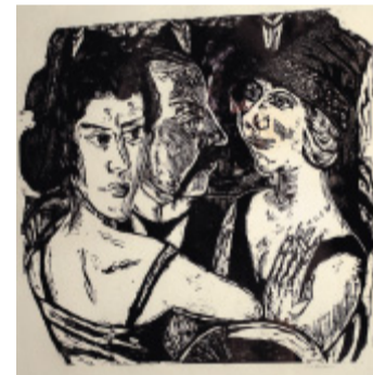
Nachtleben: „Gruppenbildnis Edenbar“, Holzschnitt von Max Beckmann aus dem Jahr 1923.