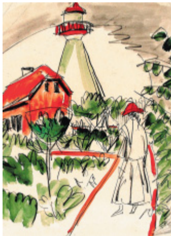
Locker: In Aquarell mit Bleistift zeigt Kirchner die „Frau im Garten mit Leuchtturm“.

Die Expressionisten artikulierten sich in eigener Realität, die jedem der Macher einen großen Freiraum an individueller Gestaltung beließ, wie die sehenswerten Blätter aus dem Folkwang-Bestand demonstrieren. Lyonel Feininger glänzt mit filigranen Radierungen voller Details und raffinierten Perspektiven sowie mit Holzschnitten, in denen er sich flächig und linear ausdrückt. In Holz geschnitten hat Max Beckmann sein Konterfei, das in feiner Durcharbeitung eher wie eine Zeichnung anmutet. Dagegen ist sein Bleistiftporträt „Simolin“ so grob, dass es fast ein Holzschnitt sein könnte. Von Ernst Barlach belegen Lithographien und drei Holzschnitte aus dem Zyklus „Die