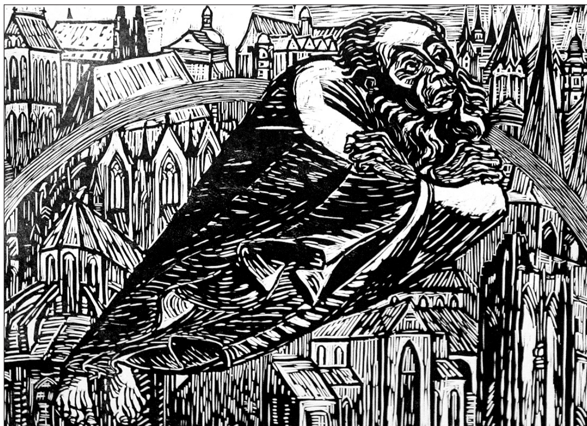
Barlach repräsentiert den religiös bewegten Expressionismus. Dieser Holzschnitt »Dome« ist Teil des Zyklus' »Die Wandlungen Gottes«, den er 1922 schuf. Von ihm sind außerdem zwei Lithographien zu sehen.