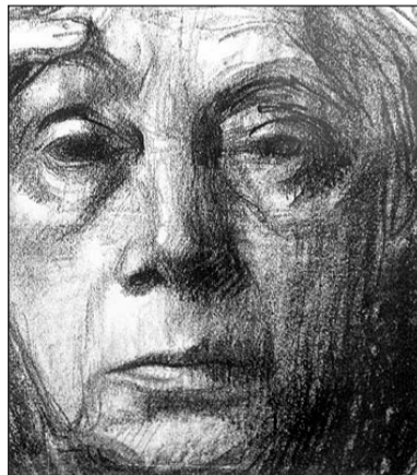
Dieses Selbstbildnis zeichnete Käthe Kollwitz 1934.