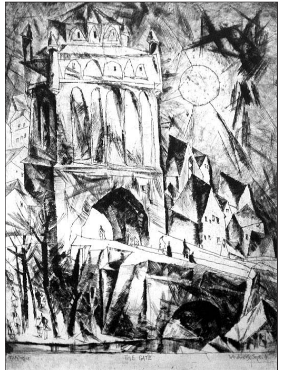
Feininger ist gleich mit vier vorzüglichen Arbeiten vertreten, hier die Radierung »The Gate« von 1912.

Doch auch Vertreter der sozial und religiös bewegten Richtung des Expressionismus', wie Ernst Barlach, Käthe Kollwitz und Max Beckmann, findet der Besucher, ebenso wie Max Pechstein mit seiner von primitiven Kunst inspirierten Arbeit »Zweigespräch«.