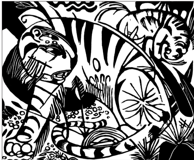
In seine phantastische Tierwelt entführt Franz Marc die Besucher unter anderem mit diesem »Tiger«, einem Holzschnitt von 1912.

Künstlern, die sich Anfang des vergangenen Jahrhunderts in ihrer Arbeit von der Darstellung der äußeren, akademischen Form abwandten, hin zur Darstellung des Inneren, seelisch Erfahrbaren.