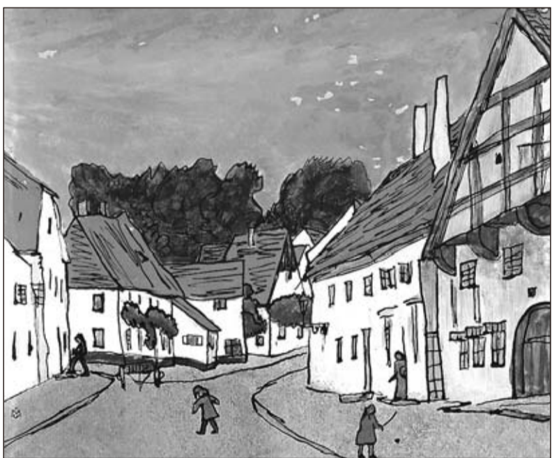
Mit Werken von Gabriele Münter – hier ein Hinterglasbild der Herforder Johannisstraße – wurde der Oosterlenbau eröffnet.