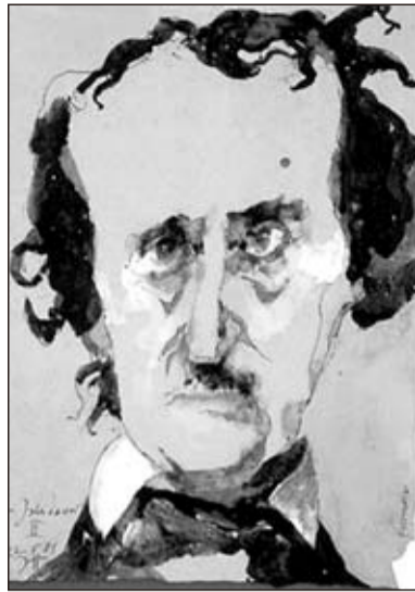
Einer der Literaten, die Janssen besonders oft portraitiert hat: Edgar Allan Poe (Farbradiierung 1988).