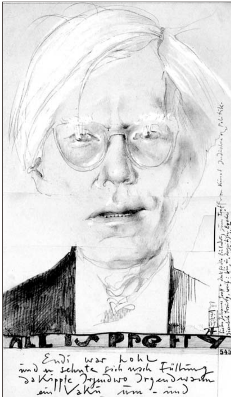
Auch für seine »Ahnen« hatte er stets eine Frechheit parat wie seine Zeilen zu Andy Warhols Portrait (Bleistift, Farbstift, Pastell 1979) zeigen.