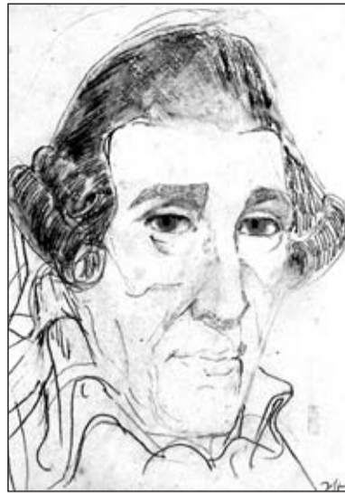
Komponist Joseph Haydn gehörte zu Janssens selbst gewählten Ahnen (Bleistift und Pastell 1990).