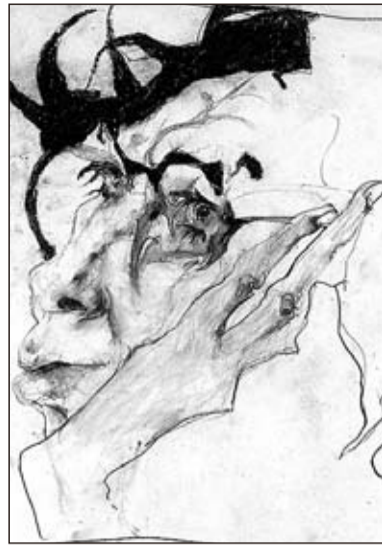
Den Verleger und Förderer Tete Böttger setzte Janssen 1988 mit dem Bleistift wirkungsvoll in Szene.