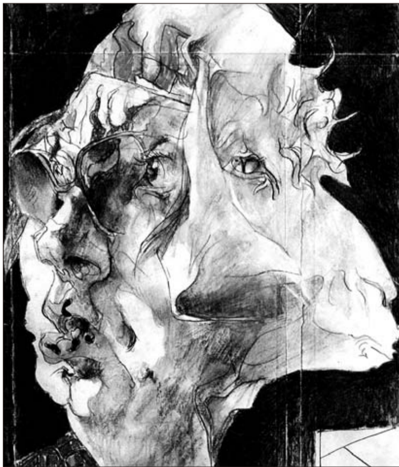
Auch mit sich selbst war Horst Janssen nicht zimperlich, wie dieses Pastell-Selbstbildnis mit Schafskopf von 1982 zeigt.

Während in den frühen Schaffensjahren des 1995 im Alter von 65 Jahren verstorbenen Künstlers das Porträt eine eher untergeordnete Rolle spielte, gewann es in den siebziger Jahren zunehmend an Bedeutung und blieb bis zum Ende seines Lebens eines seiner wichtigsten Themen. So liegt auch der Schwerpunkt der Ausstellung, deren früheste Arbeit die Kleist-Zeichnung von 1952 ist, auf den Arbeiten der 70-er bis 90-er Jahre, als die großen Zeichnungen der Weggefährten entstanden. Die frechen Unterzeilen zu ihren Charakteren lieferte er meist gleich mit.