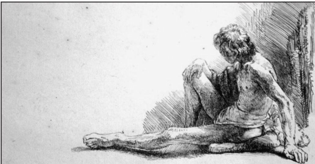
Perfekt: Männlicher Akt am Boden sitzend, Radierung von 1646. Die Figur, mit treffendem Strich erfasst, bekommt durch Schraffuren ihre plastische Wirkung.