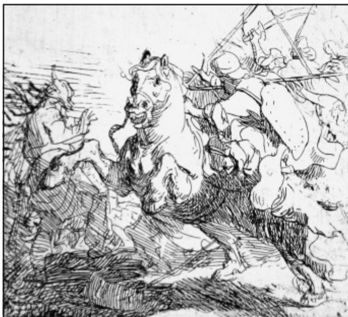
Bewegt: Das Reitergefecht, Radierung um 1623, zweiter Zustand. Lebendig ist das Gegeneinander der Kämpfenden erfasst.