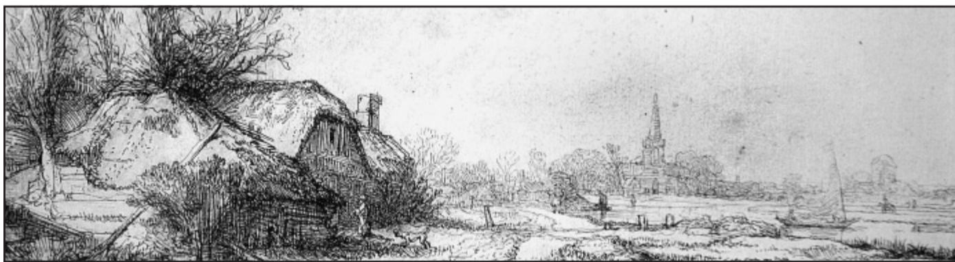
Typisch: Gehört an einem Kanal, Radierung um 1645. Möglicherweise handelt es sich um einen Blick auf den Ort Diemen (Ausschnitt).

◆ Abfragen mit Sonja Ziemann-Heitkemper unter ☎ 0 52 21 - 6 48 89, E-Mail: Ziemann-Art@aol.com