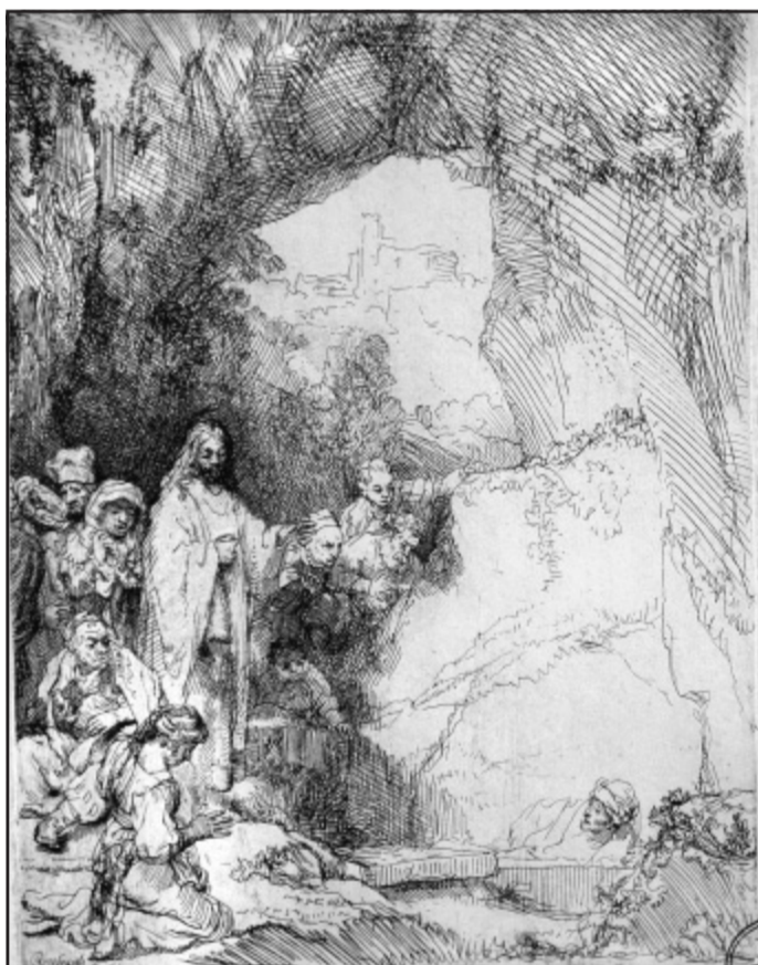
Spannend: Weiße Flächen stehen gegen perfekt durchgezeichnete bei der Darstellung des Wunders. Das prägt „Die Auferweckung des Lazarus“, 1642 als Radierung angelegt und mit der Kaltnadel überarbeitet.