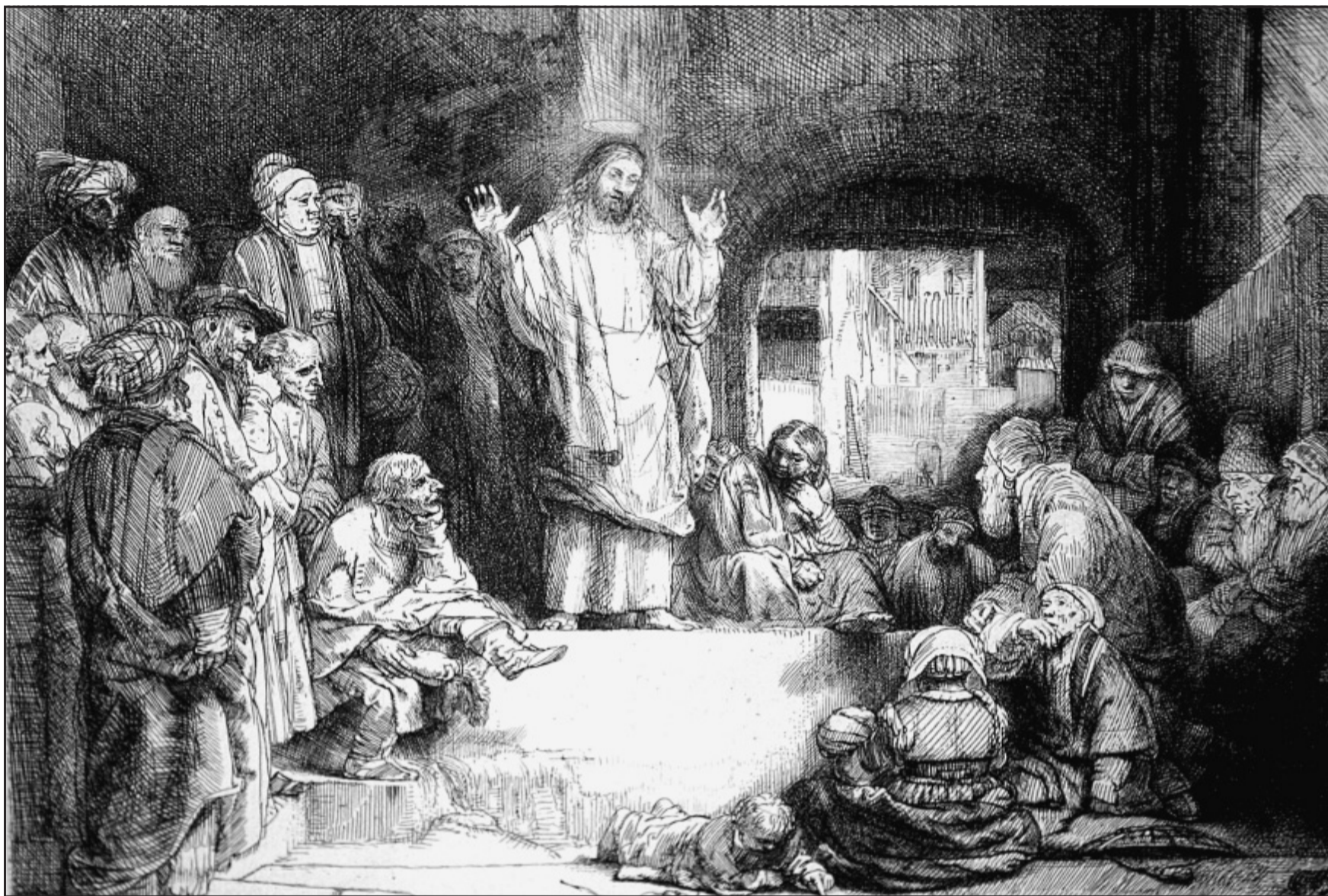
Gebannt: Aufmerksam hören die Menschen Jesus zu, abzulesen an den interessierten Gesichtern. Nur das Kleinkind im Vordergrund mit dem Kreisel wendet sich seinem Spiel zu. „Christus lehrend“ heißt das Blatt, das 1652 als Ätznadierung angelegt und mit Kaltnadel sowie Grabstichel weiter durch- und ausgearbeitet worden ist.