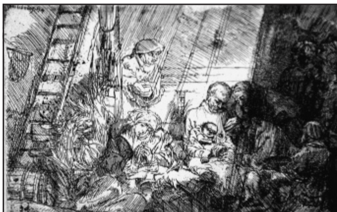
Dramatisch: Die Beschneidung, 1654 gearbeitet, gewinnt an Aussage durch den starken Hell-Dunkel-Kontrast des Blattes.