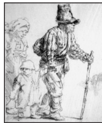
Ältestes Blatt: Bettlerpaar von 1630. Das Blatt gehört zu den späten bei Basan in Paris von der Originalplatte gedruckten Abzügen.

Rembrandt wurde am 15. Juli 1606 in Leiden geboren. Dort und in Amsterdam ging er bei Malern in die Lehre. Mit 20 Jahren begann seine eigenständige künstlerische Arbeit. 1631 siedelte er nach Amsterdam über. 1634 heiratete er Saskia van Uylenburgh und wurde reich, Saskia starb 1642. Nach 1650 verlor Rembrandt sein Vermögen. Er starb am 4. Oktober 1669 verarmt in Amsterdam.