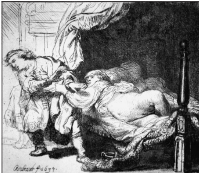
Frivol: Joseph und Potiphars Weib, Radierung von 1634. Mit allen Mitteln versucht die Dame den sich Wehrenden in ihr Bett zu locken.