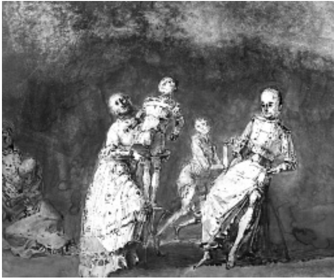
Altmeisterlich: Ölbilder, Aquarelle und Zeichnungen stellte Werner Tübke im Spätherbst 1995 im Pöppelmann-Haus aus. Hier ein Ausschnitt aus einer Radierung kombiniert mit Tuschezeichnung ohne Titel aus dem Jahr 1988.

Den Grundstock zur Sammlung, die zusammenzutragen sich der 1955 gegründete Kunstverein aufgerufen fühlte, legte