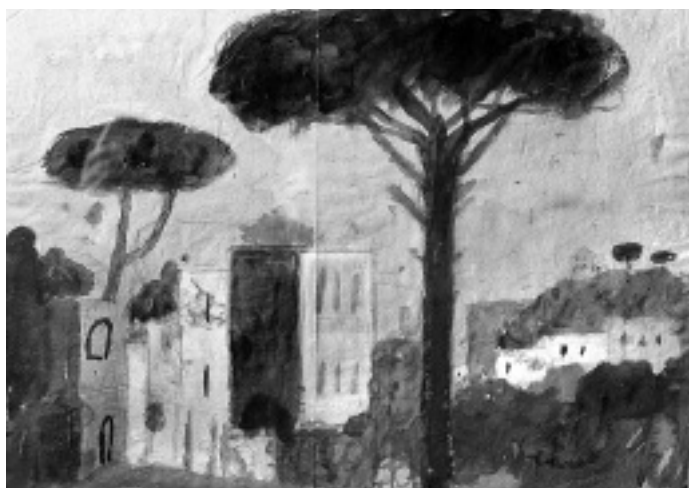
Weniger gefragt: In den 50er Jahren erfreuten sich die südlichen Landschaften Max Pfeiffer-Watenphuls großer Beliebtheit auf dem Kunstmarkt. 1960 zeigte er Arbeiten auf Einladung des Kunstvereins in Herford, so auch das Aquarell „Italienische Landschaft mit Pinien und Häusern am Meer“.