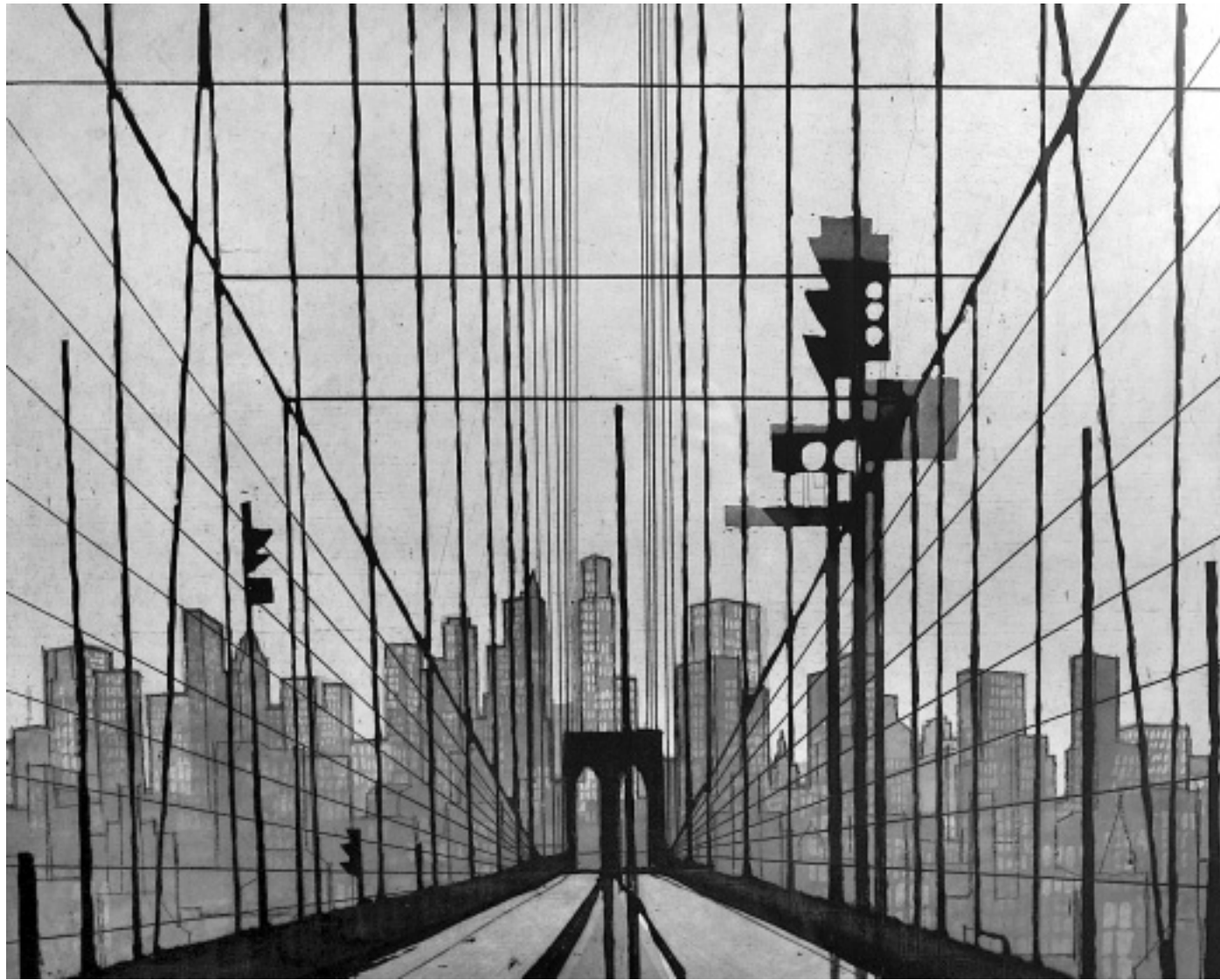
Idealisiert: Die weltbekannte Brooklyn Bridge hat Otto Eglau 1965 in seiner großflächigen Farbradierung thematisiert. Das konsequent grafisch aufgefasste Motiv wirkt von daher eher konstruiert, als in irgend einer Art auf die Wirklichkeit bezogen.