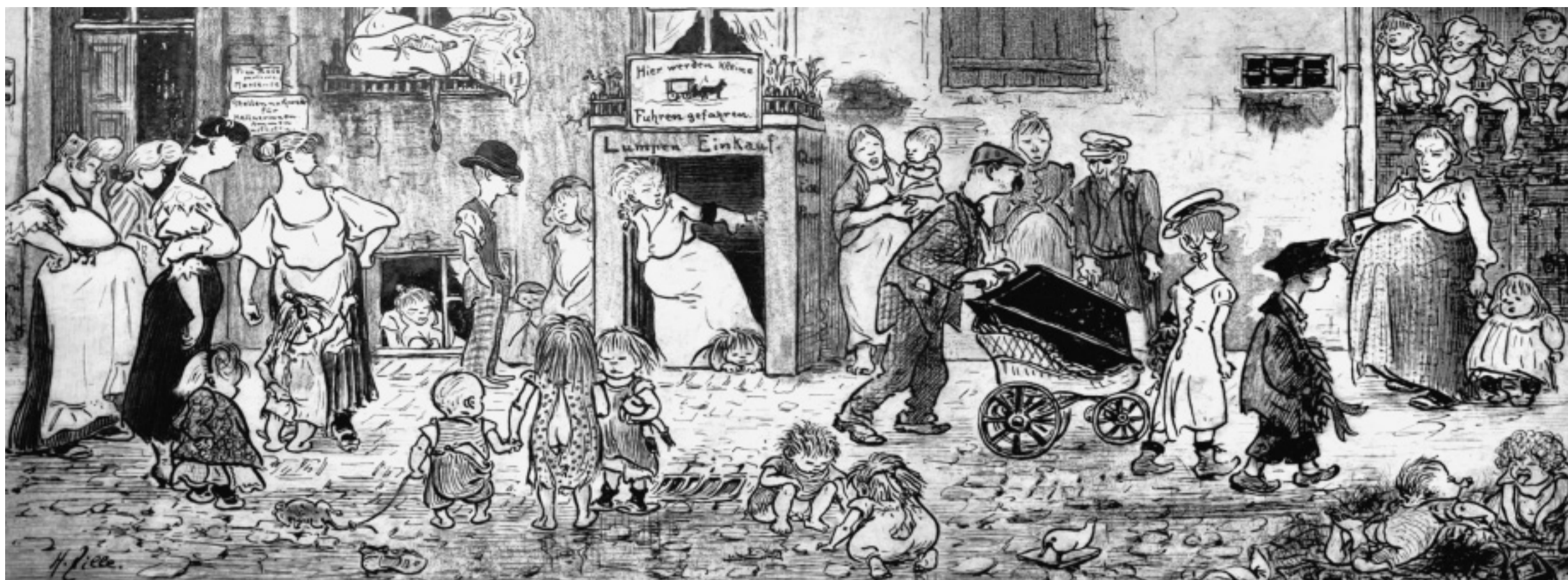
Alltag im Milljöh: Um 1905 arbeitete Heinrich Zille das Motiv „Zur Mutter Erde“, in dem ein Schnauzbärtiger einen Kindersarg auf der Sportkarre durch die Straße fährt. Vorneweg wandern offensichtlich Geschwister mit Kränzen. Die Nachbarschaft, zumeist Mütter mit Kleinkindern, nimmt von dem Beerdigungszug zwar Notiz, aber großartige Gemütsregungen sind bei keinem der Zaungäste zu registrieren.