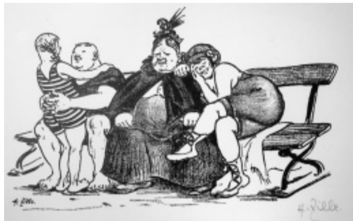
Neckisch: Die republikanische Stöpseljule, gemeint ist eine Telefonistin, mit Familie. Lithographie um 1924, in Stein und Druck signiert.