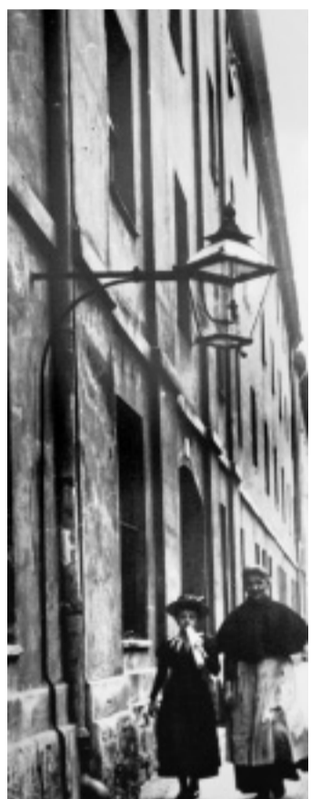
Vorlage: Die Laterne, fotografiert 1897, taucht in der nebenstehenden Radierung wieder auf.