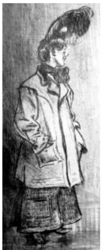
Fein gemacht: Frau mit Pleureuse, Radierung um 1903.

„Mutta, wat kochste?“ „Wäsche, Du Dummbatts!“ „Schmeckt'n det jut!“