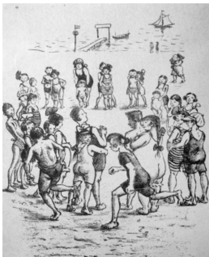
Freizeitspaß einst: Kinder beim Kreisspiel, 21. Blatt aus dem Zyklus „Komm Karlineken, komm“, als Litho 1924 in Stein gezeichnet.