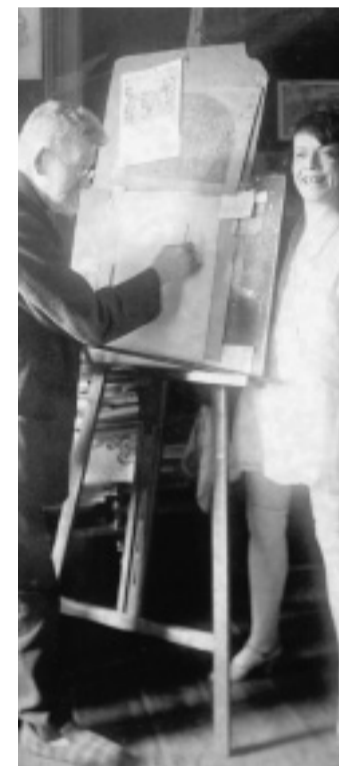
Schnappschuss: Heinrich Zille an der Staffelei mit Senta Söneland, Foto um 1925.

Das Beherrschen der menschlichen Anatomie kommt in den lebensprühenden Badeszenen