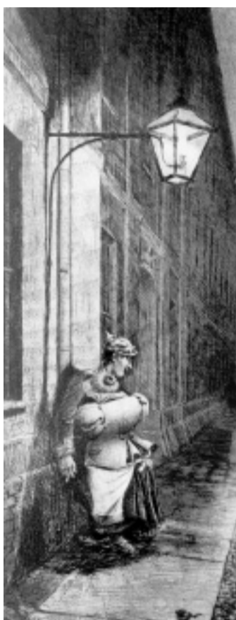
Trist: Kaisers Geburtstag, Radierung und Aquarelle von 1899, nach fotografischer Anregung.