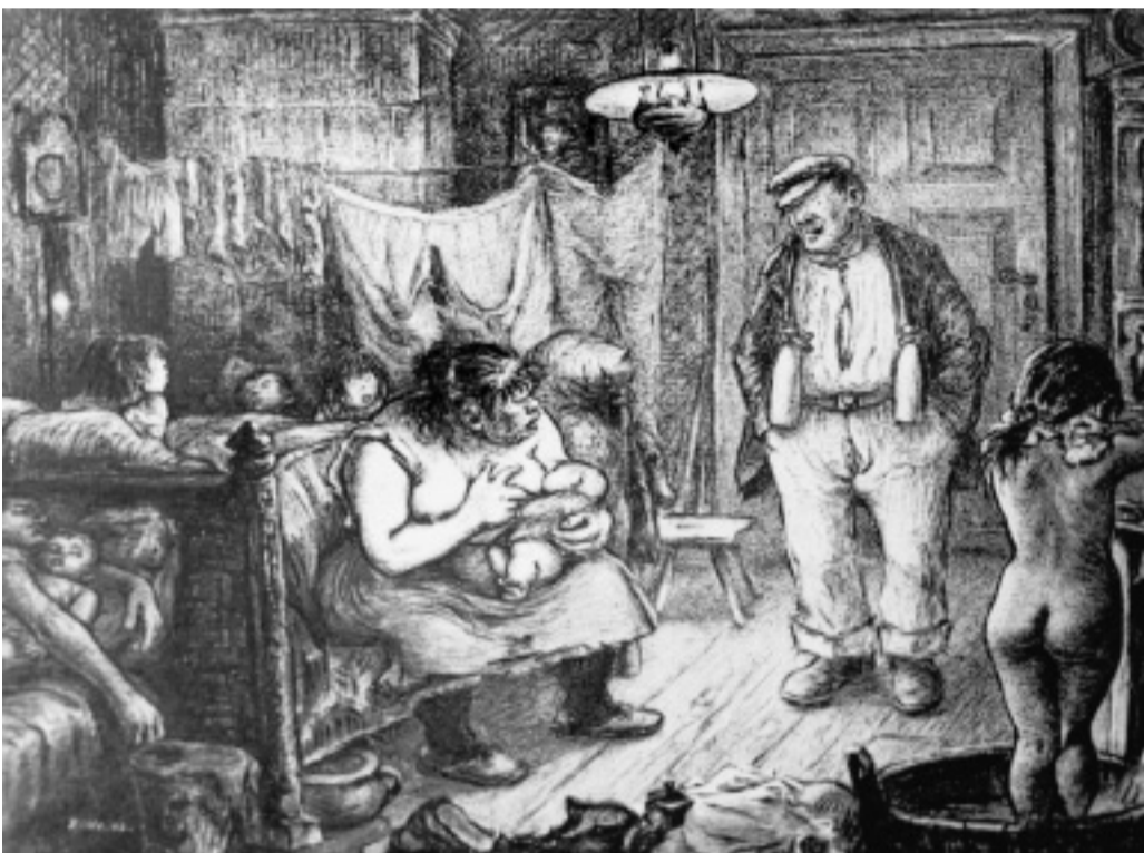
Elend: Am Kachelofen trocknet Wäsche, die meisten Kinder schlafen schon, ein Mädchen wäscht sich in der Wanne, Mutter gibt dem Jüngsten die Brust, da taucht auch noch „Der späte Schlafbursche“ auf. Diese Hellogravüre mit diesem Titel arbeitete Heinrich Zille 1902.

Zille hatte den Blick für die Probleme der so genannten kleinen Leute, die im Berlin der Kaiserzeit, des Ersten Weltkrieges