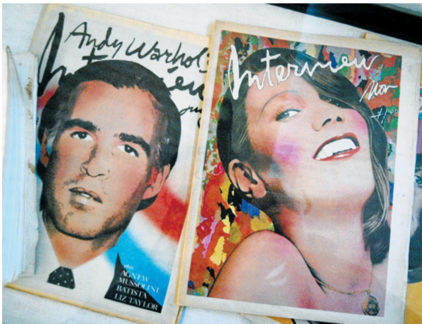
Zeitungsmacher: 1969 gründete Andy Warhol die Zeitschrift „Interview“, die als Vorläufer heutiger Zeitgeist-, Lifestyle- und Fashionpublikationen gilt. Das Sujet „Porträt“ fand den Weg vom Zeitschriftentitel in seine Plakat-Kunst.