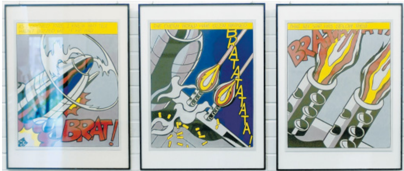
Triptychon: Roy Lichtensteins „As I Opened Fire“. Klare Farben – schwarz, weiß, gelb, blau, rot – und die Linienführung erinnern an Comics. Andere Pop-Art-Künstler wie Robert Rauschenberg oder Larry Rivers nahmen die Technik der Collage auf.