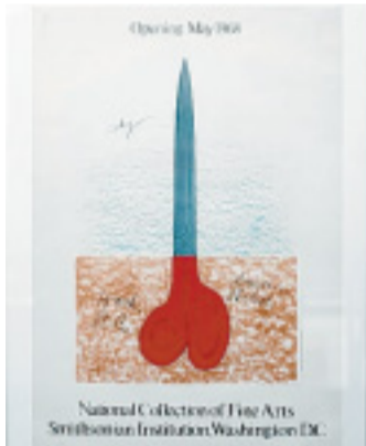
Phallus 1: „Scheren-Obelisk“ von Claes Oldenburg.