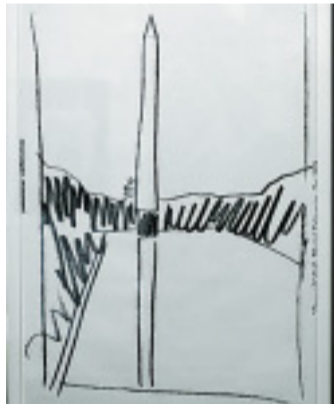
Phallus 2: „Washington Monument“ von Andy Warhol.