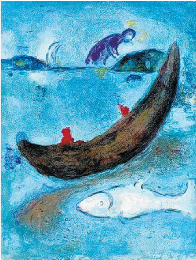
Bewegt: Das diagonal gestellte Fischerboot dominiert die Lithografie „Der tote Delphin und die 3.000 Drachmen“.