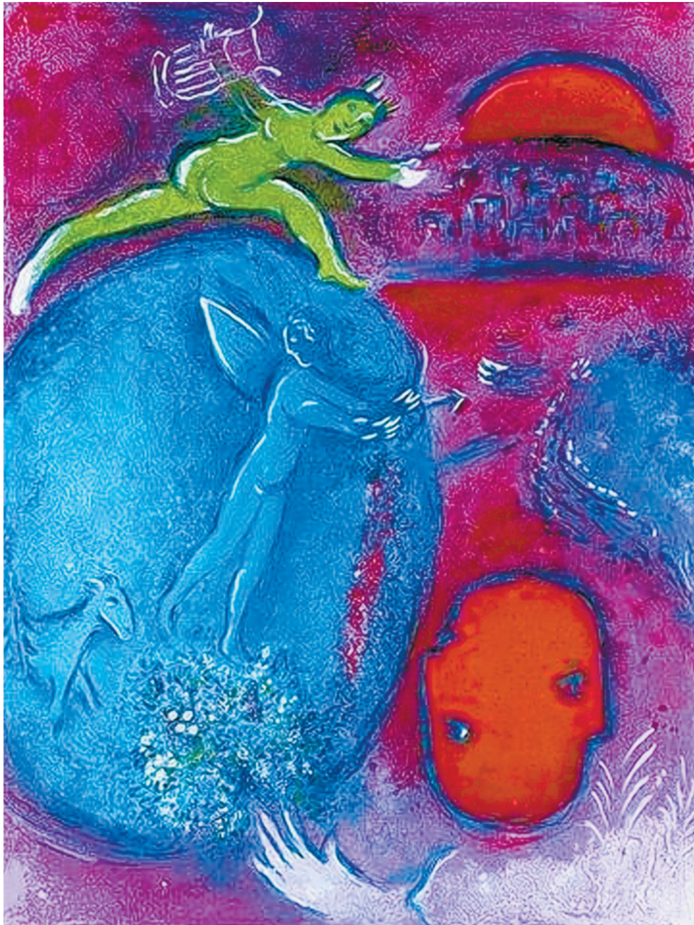
Nicht von dieser Welt: In glutvoller Farbigkeit hat Marc Chagall das Motiv „Der Traum von Lamon und Dryas“ seines Daphnis & Chloé-Zyklus angelegt. In dieser Arbeit hat er eine seiner gestalterischen Vorlieben – schwebende Wesen – mehrfach realisiert.