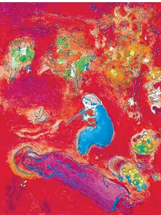
Sonnenglut: Leuchtendes Rot steht für die flirrende Hitze eines griechischen „Sommermittags“, wie Chagall dieses Motiv genannt hat.