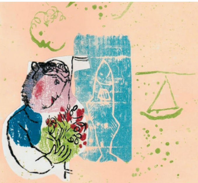
Rarität: Der Holzschnitt „Der Garten“ zu dem gleichnamigen Gedicht ist eine Collage. Das Papierstück mit dem Fisch hat Chagall eigens in das Motiv eingesetzt.