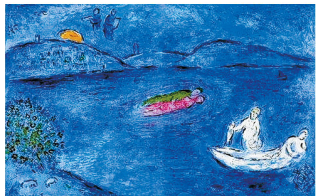
Sinfonie in Blau: Um das Motiv „Das Echo“ nach seinen Vorstellungen in unterschiedlich dichten Blautönen drucken zu können, fertigte Chagall mehrere Druckplatten allein für den Blaudruck an.