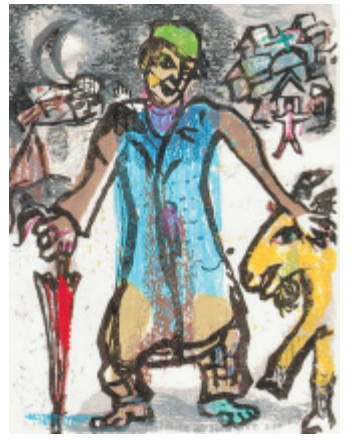
Eindeutig: Formtypisch für Chagall der Holzschnitt „Die Stadt“.